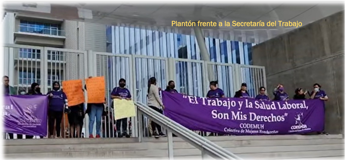
Plantón frente a la Secretaría del Trabajo