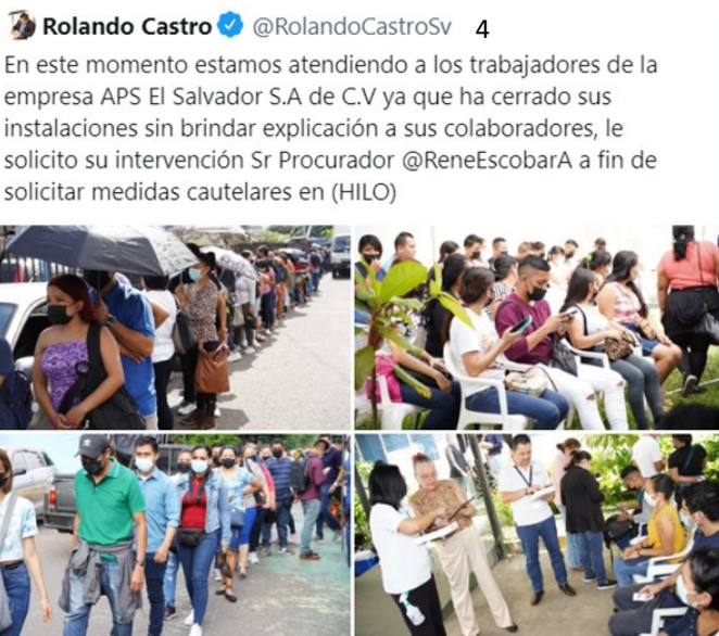
9:43 a. m. · 31 ago. 2022

Al respecto, el ministro de trabajo, Rolando Castro informaba, a través de twitter, el 31 de agosto de 2022, que se estaban ocupando de la situación para tomar medidas cautelares y asegurar ciertas garantías para las personas trabajadoras, pero no se ha informado públicamente sobre los resultados o las acciones tomadas a la fecha.